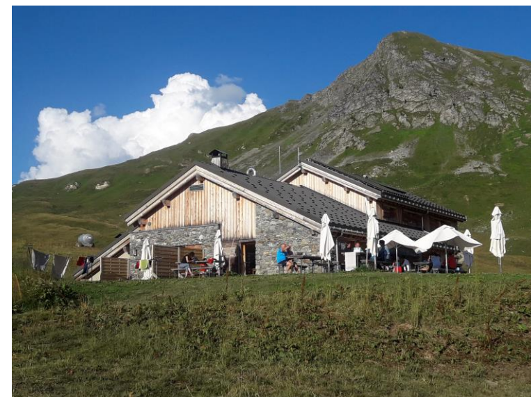
Refuge du Nant du Beurre en vue !