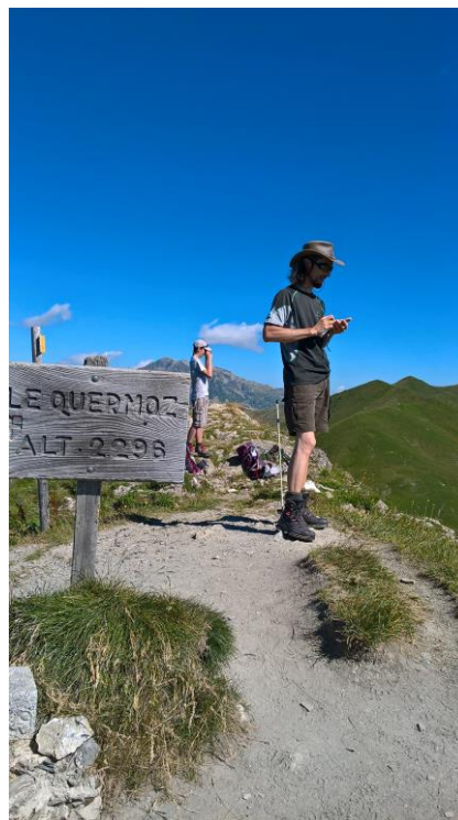
A chacun son sommet !